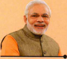
માન. શ્રી નરેન્દ્રભાઈ મોદી માન. વડામંદાલશ્રી